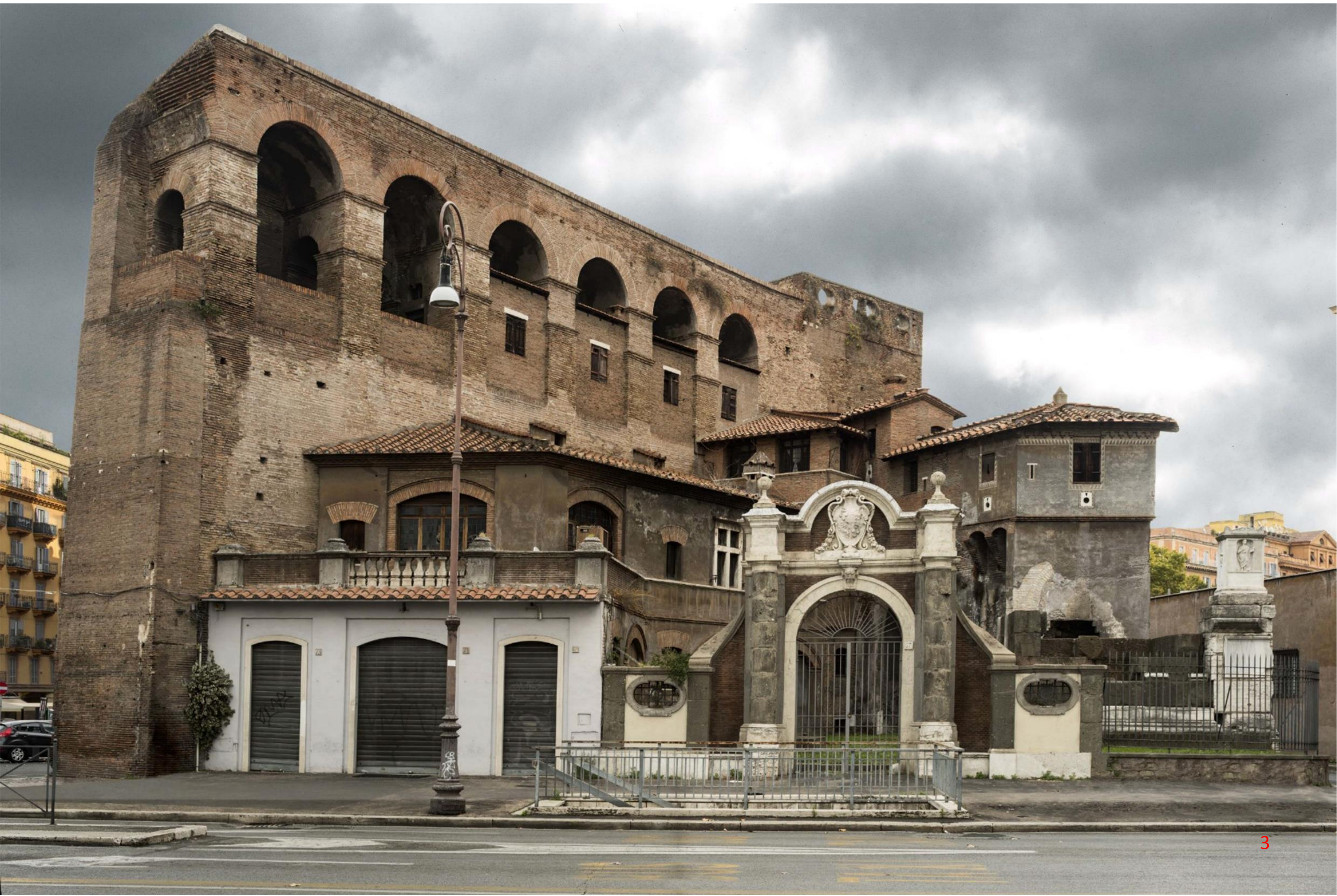
PORTA SALARIA (demolita nel 1871) - Piazza Fiume-Monumento a Quinto Sulpicio Massimo-Villino Ferrari-Sepolcro di Cornelia